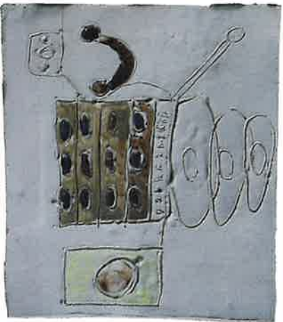
LUCIEN MOELANTS keramiek engobe en glazuur MUZIEKINSTALLATIE