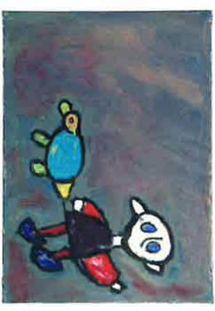
DIRK VERRETH olieverf op doek MAN MET HOND