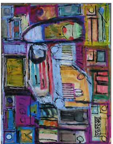
CHRISTIAN THIENPONT gemengde techniek ZONDER TITEL