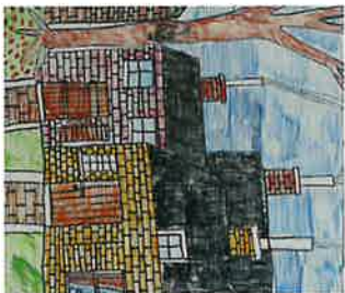
JERRY DE GREEF pen, oostindische inkt en ecoline DORPSSTRAAT