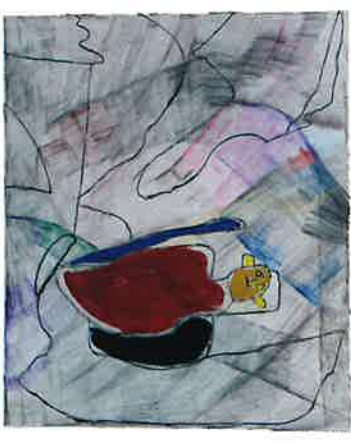
STEPHAN VERLINDEN gemengde techniek STILLE