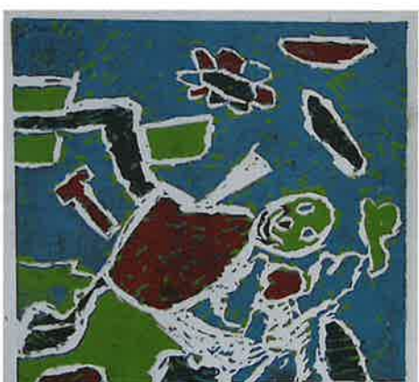
JOHAN OLBRECHTS houtsnede DE VOETBALLER