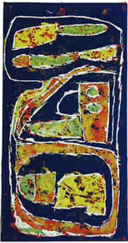
JOHAN VAN MALDER houtsnede DE HAVEN