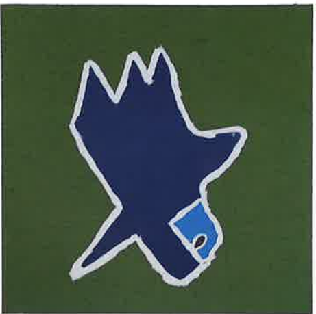
NICO LEPAGE zeefdruk VOGEL