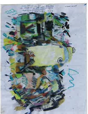
AN VAN HECKE gemengde techniek ZONDER TITEL