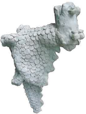
FREDDY GOOSSENS keramiek DRAAK