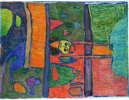
ELS VAN RILLAER ets op plexi en aquarelpotlood DE BUURVROUW