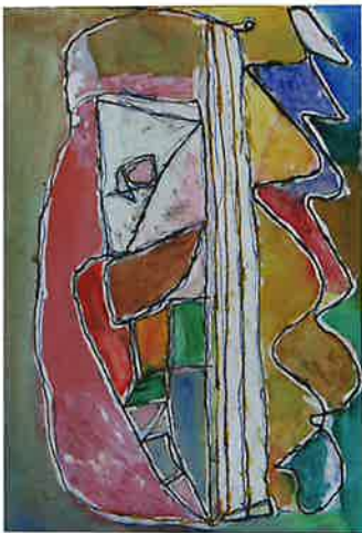
SANDRA VAN ACKER aquarelverf + afdekvlouistoef en inkt WERKDAG